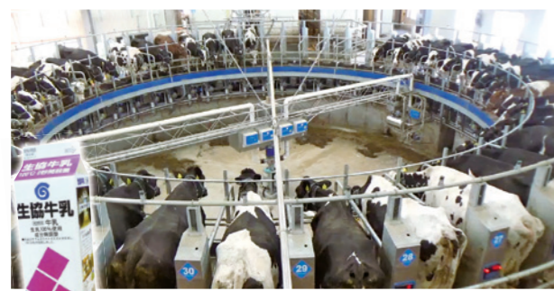
ロータリーパーラー

現在約420頭の作乳牛から毎日約12~13トンの生乳を生産、鳥取県内で生産された原乳とあわせて、コープしがの「生協牛乳120」として組合員に届いています。