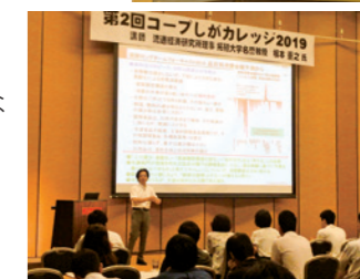
コープカレッジ：テーマ「市場、流通の現状、将来展望と生協の課題」